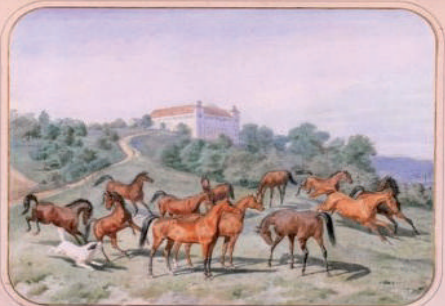
Louis Braun von 1896

zudem, dass mit dem Kulturamt des Landkreises Göppingen und der Kreisarchäologie ebenfalls die für die Denkmalpflege und für die Entwicklung des historischen Profils des Schlosses kompetente Stelle im Schloss angesiedelt ist. So ergeben sich wichtige Synergien für Schloss Filseck.